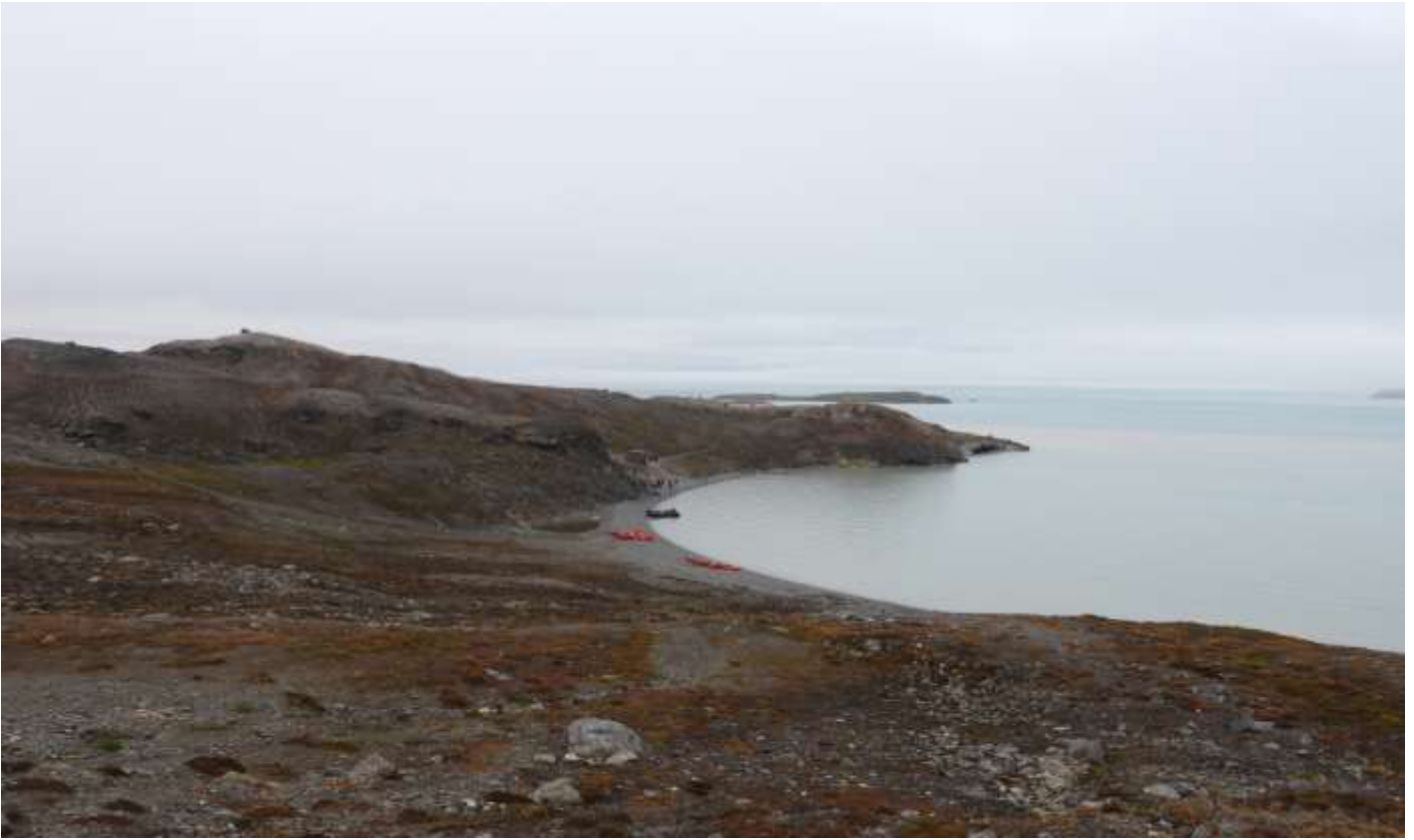
เขตอนุรักษณ์ธรรมชาติซอร์ราสต์ (Soraust Svalbard Nature Reserve)

เป็นเกาะขนาดเล็กทางตอนเหนือของสวาลบาร์ด มีพื้นที่เนินเขาเตี้ยๆและอยู่ใกล้กับธารน้ำแข็งทางตอนเหนือของสวาลบาร์ดอีกด้วย ที่นี่ได้รับการขนานนามว่า อ่าวแห่งรัก (Love Bay) ท่านจะได้ชื่นชมทัศนียภาพและความสวยงามของอ่าว รวมถึงสัตว์ไม่ว่าจะเป็นหมีขาว แมวน้ำ ที่มีถิ่นอาศัยในบริเวณนี้เช่นกัน